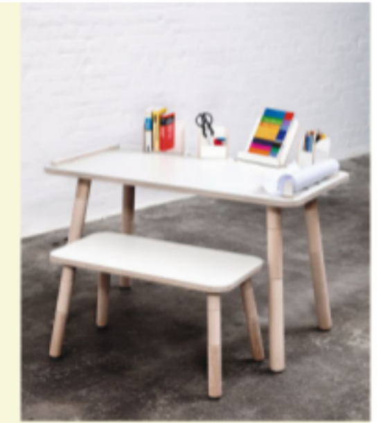
Malbereitschaft „Growing Table“ mit Papierhalter, runden Ecken und mitwachsenden Beinen, B 120 cm, ab ca. 550 Euro (Connox).

Malen, basteln, bauen sind die ersten Aktivitäten, die Kinder am eigenen Tisch erledigen. Dazu wählt man ein robustes Modell, das eventuell sogar mitwächst. Für Schüler ist ein höhenverstellbarer Schreibtisch mit Ablagen für Stifte und Bücher ideal.