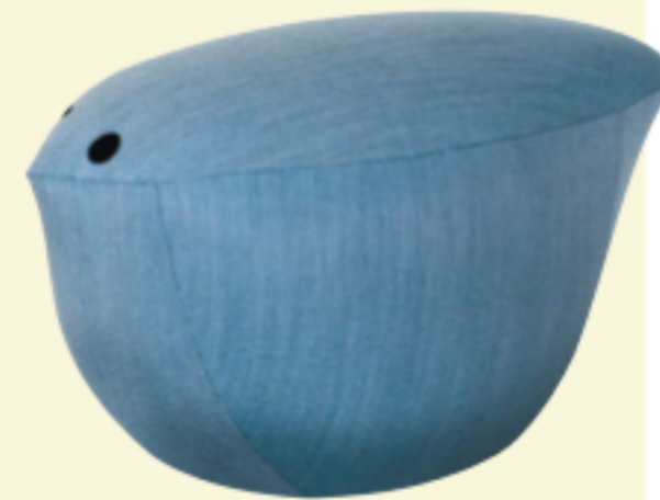
Kleiner Freund Hocker „Birdy“ ist ein lustiger Zusatzsitz (nicht nur!) im Kinderzimmer, in 10 Farben, ca. 222 Euro (Now! by Hülsta).

Zum Lesen Die Microperlen im farbenfrohen Sitzsack (r.) passen sich der Sitzposition perfekt an, ø 90 cm, ca. 100 Euro (Jako-O).