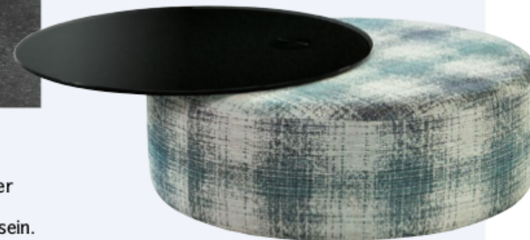
Hocker mit Ablage. Sitzen, Füße hochlegen, Getränk abstellen: „Luna“ mit schwenkbarer Rauchglasplatte ist für alle Fälle gerüstet, ø 90 cm, ab ca. 940 Euro (Bielefelder Werkstätten).