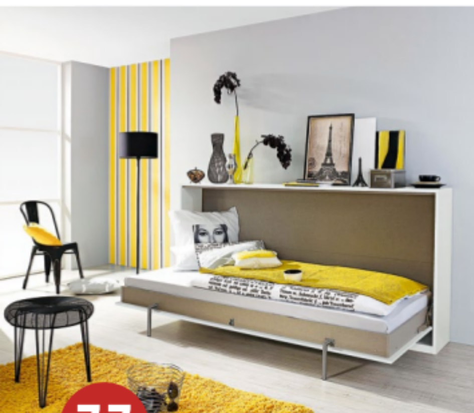
Schrankbett Im Gäste- oder Jugendzimmer spart ein Bett, das nur zum Schlafen erscheint, wertvolle Quadratmeter. Modell „Albero“ der Marke „Pack’s“, ca. 600 Euro (Rauch).