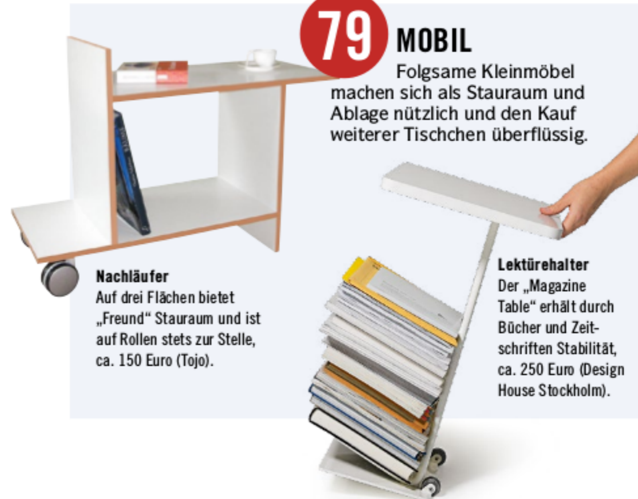
Nachläufer Auf drei Flächen bietet „Freund“ Stauraum und ist auf Rollen stets zur Stelle, ca. 150 Euro (Tojo).

Folgsame Kleinmöbel machen sich als Stauraum und Ablage nützlich und den Kauf weiterer Tischchen überflüssig.