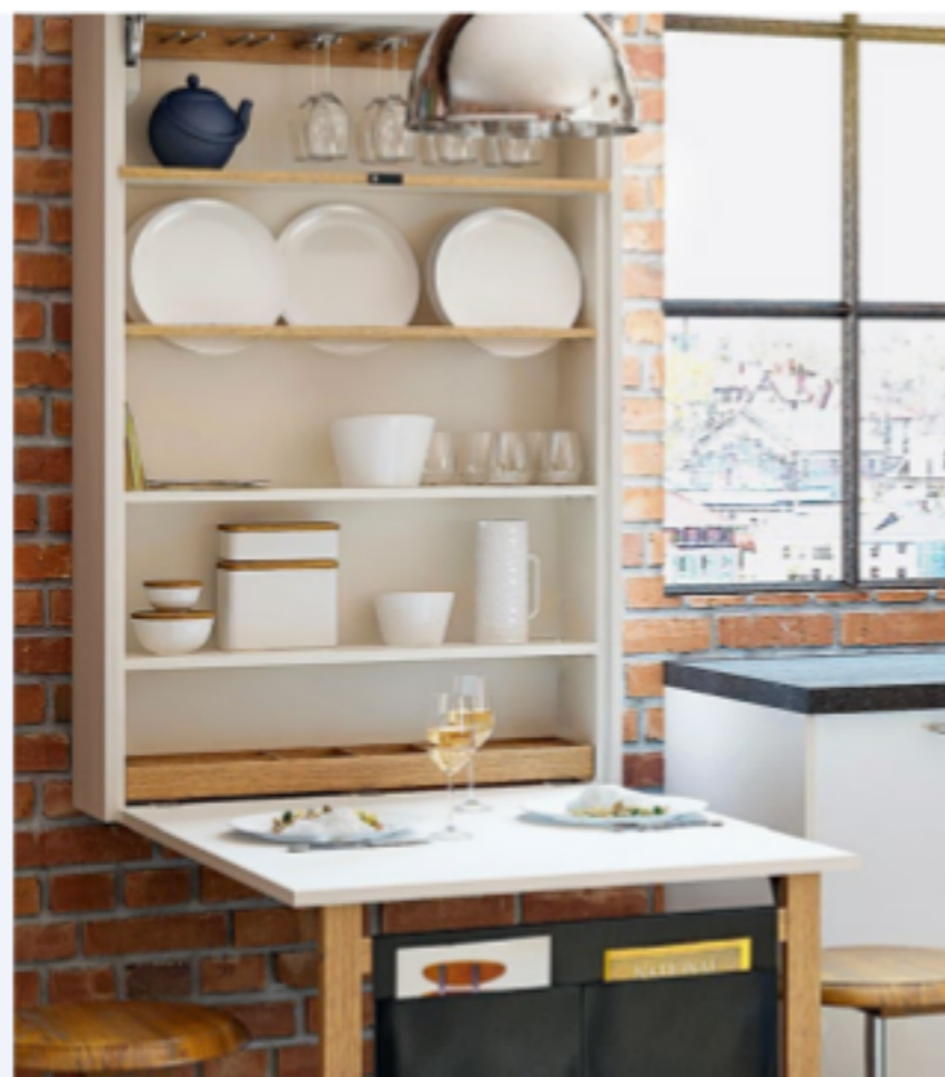
Tellerbord mit Bedarfstisch. Aus dem Wandregal kann das Geschirr direkt aufgedeckt werden, sobald der Tisch geöffnet ist. Sonst fungiert er als schicke Front, ca. 900 Euro (ewe).